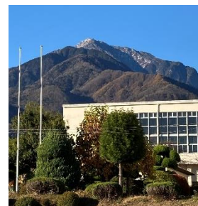
初冠雪翌日の朝、校庭からみた甲斐駒ヶ岳

朝夕の寒さが身にしみる季節になってきました。学校園の樹木は赤や黄色に色づき、彩りを添えています。今週月曜日には甲斐駒ヶ岳も初冠雪が確認され、いよいよここ白州の地に冬が近づいてきました。22日には合唱祭を控え、校舎内に歌声が響き、潤いのある学校生活を送っています。新型コロナウイルスが5類に移行されて迎えた秋。昨年に比べ、様々な場面で活躍する子どもたちも多く、実りある秋になりました。スポーツの秋、読書の秋、芸術の秋…。保護者の皆様、地域の皆様、子どもたちのそれぞれの秋にこれからも温かなご声援をお願いします。